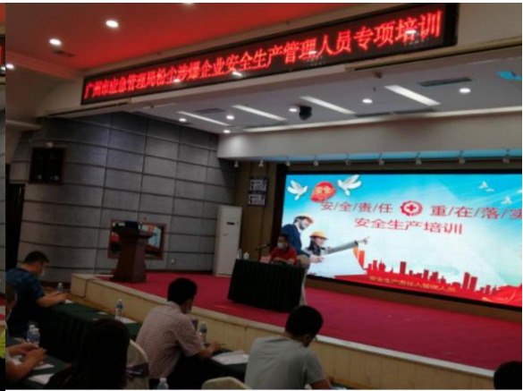
粉尘涉爆企业安全培训