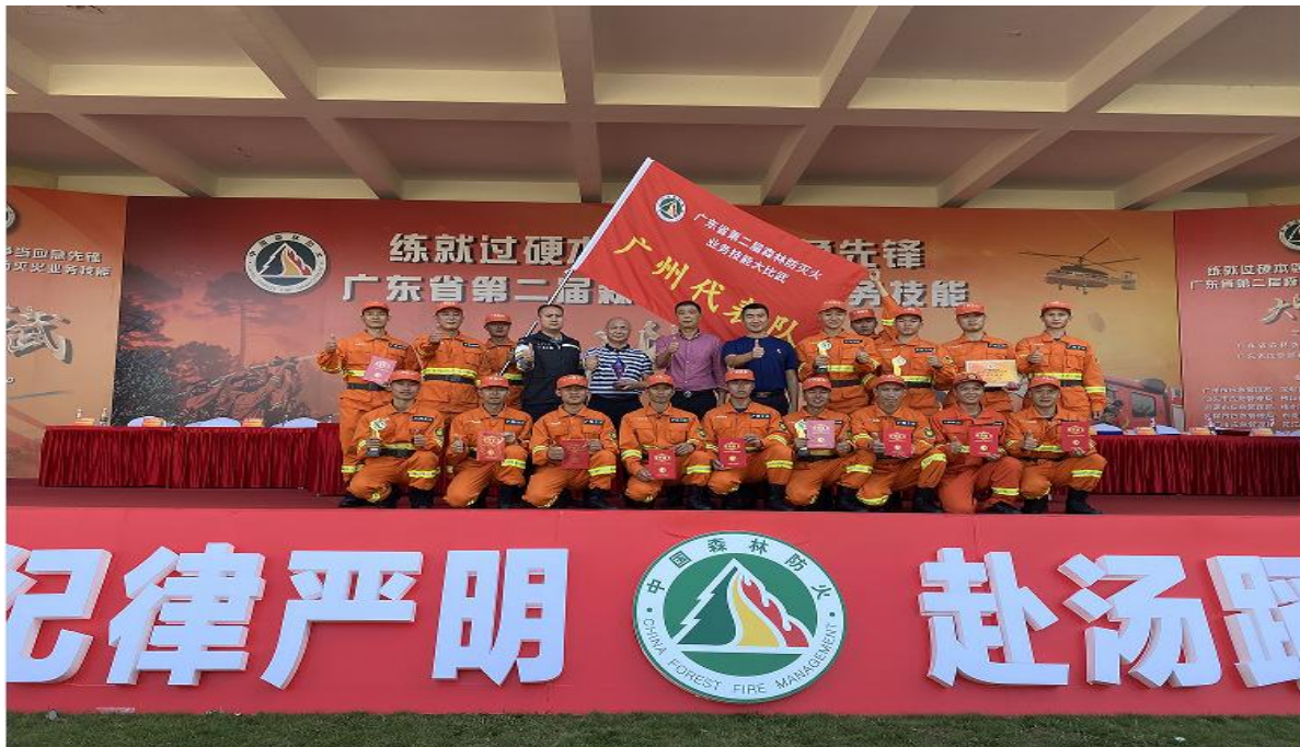
全省森林防灭火大比武获奖照片

三等奖：肇庆代表队、河源代表队、珠海代表队、 中山代表队、汕头代表队、东莞代表队