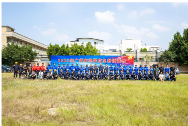
防震减灾宣教活动照片