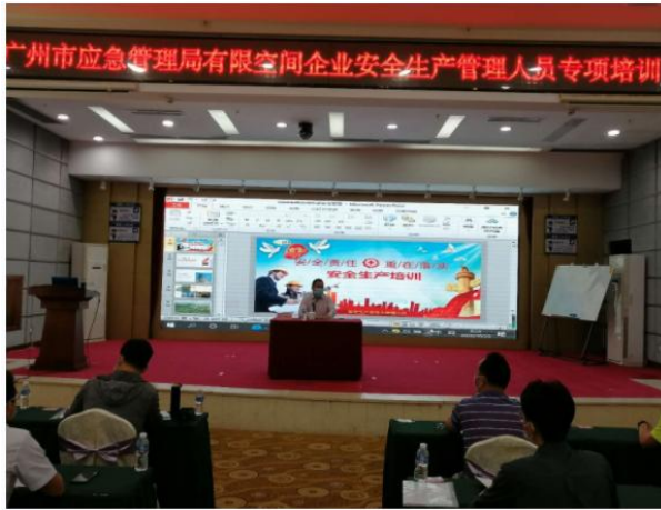
有限空间安全培训