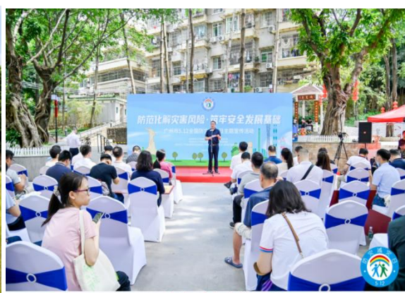
5.12防灾减灾宣教活动