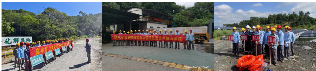
部分应急演练照片

2024 年，我司结合生产需要制定了年度应急演练计划，组织或参与了多场次应急预案或现场处置方案演练，包括消防、防汛、防泄漏、交通安全、心肺复苏、AED 实操、矿山边坡坍塌、盲炮处理、氨水泄漏、机械伤害、高处作业伤害以及触电伤害等，共 54 场次，其中综合演练 2 次，专项演练 2 次，现场处置方案演练 49 次，参加演练共 1160 人次。通过应急演练，提升了员工的安全防范意识和应对突发事件的处理能力。